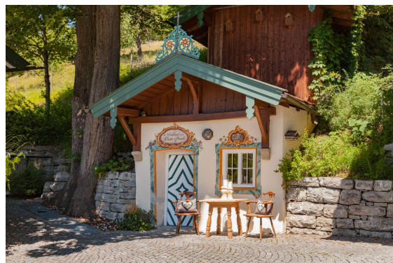
Weinhäusl zum Kiem Lauli